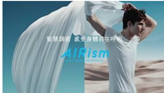
圖二：UNIQLO AIRism 涼感衣廣告片段