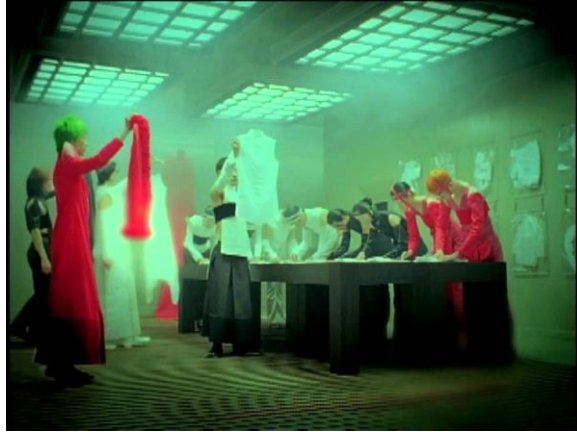
圖三：中興百貨衣服廣告片段