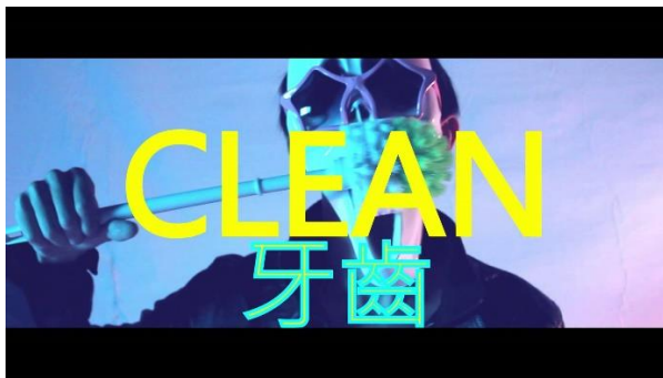
圖一：馬桶刷廣告片段

影片中的馬桶刷卻被當作刷洗身體、掏耳朵的工具，或是可以攜帶出門參加派對時使用，完全顛覆馬桶刷原本的價值，廣告影片內的馬桶刷所表達的意義顯得很無厘頭，也使馬桶刷失去原本的意符。